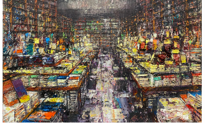
Bookshop I | 2023 | Oil on linen | 60 x 80 cm (23.6 x 31.5 in)