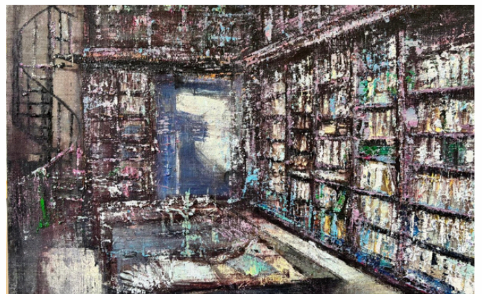
Scala a Chiocciola | 2024 | Oil on linen | 40 x 60 cm (15.8 x 2.6 in)