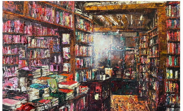
Bookstore | 2022 | Oil on linen | 60 x 80 cm (23.6 x 31.5 in)