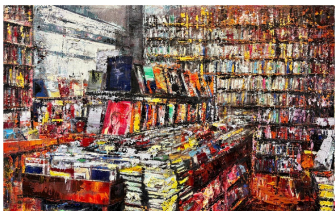
Bookstore con Red Cover | 2024 | Oil on linen | 40 x 60 cm (15.8 x 23.6 in)